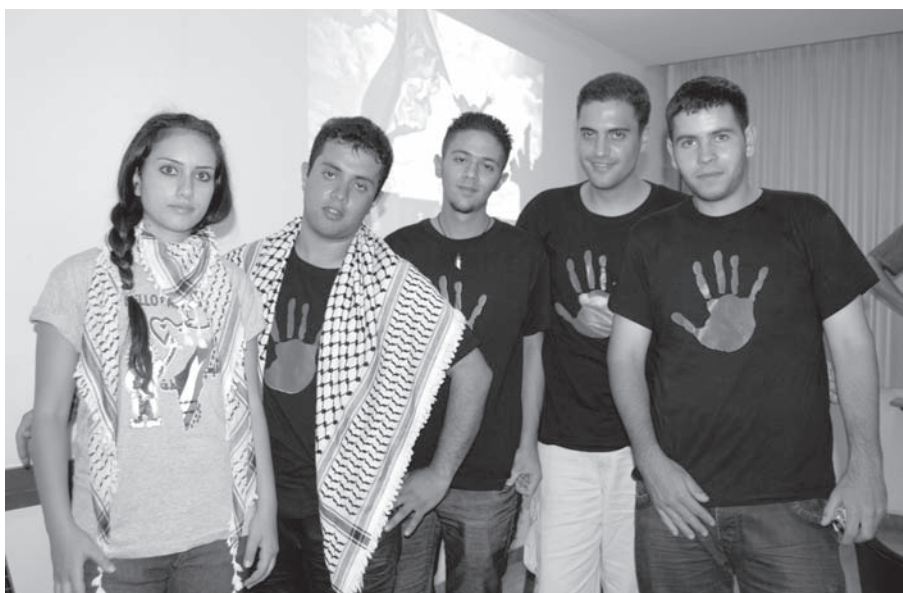
El grup de joves que han viatjat fins a Barcelona.

Si una cosa han descobert els joves catalans en la seva relació amb els palestins al llarg d'aquests dos anys de contactes,