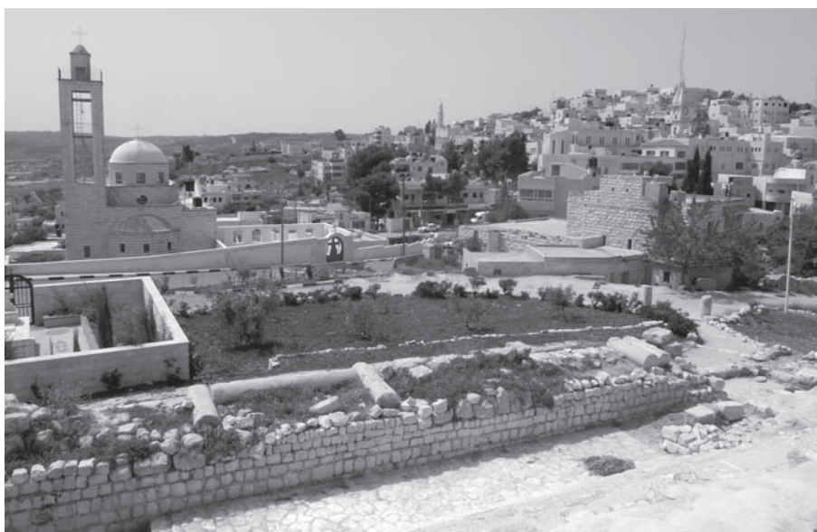
Taybeh és l'últim poble palestí completament cristià.

és que aquests darrers són els hereus directes de les primeres comunitats cristianes, de la primera Església. Tant és així que els agrada dir que a Taybeh, juntament amb els seus germans palestins, han pogut veure amb els ulls i tocar amb les mans el cinquè Evangeli. «En un context tan difícil com el que viuen —explica Albert Zaragoza, que va ser per Setmana Santa a Taybeh—, els joves palestins